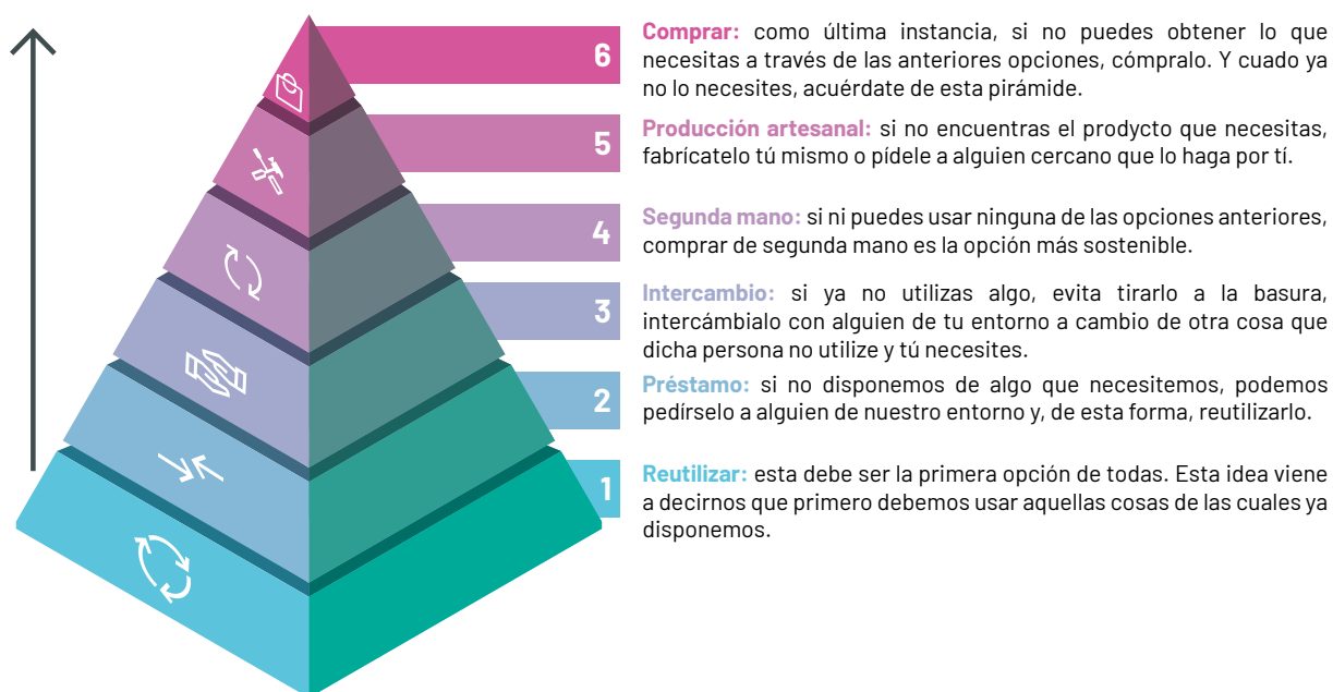
Pirámide de preferencias de la economía circular

Para cambiar dicha problemática, proponemos la instauración de la economía circular . Esta se basa en unos valores totalmente diferentes a los de la economía lineal. En dicho estilo de vida, se promueven las ideas de compartir, reutilizar y reciclar además de promover el consumo responsable y la buena gestión de los recursos. Asimismo, para una mejor comprensión de la idea de economía circular hemos descrito, de manera gráfica, dicha idea a partir de la realización de una pirámide.